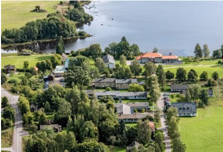
Vy över Sjöviks folkhögskola.