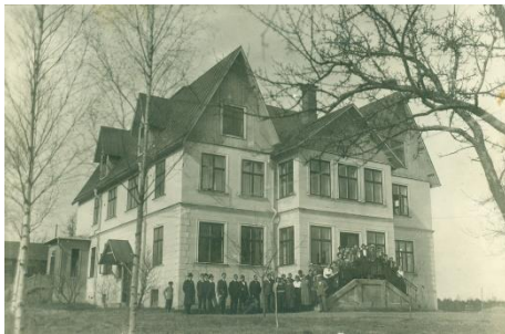
Gamla skolan på Sjövik