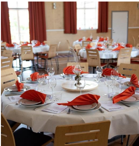
Fint dukade bord i matsalen

Känn dig alltid välkommen till våra resor och samlingar! Vår hälsningar från styrelsen i RPG Distrikt Stockholm –Gotland